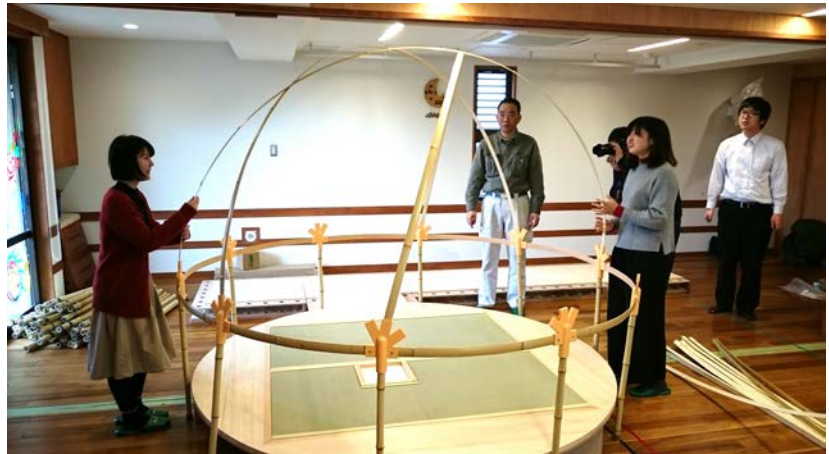
ドーム竹骨材組立