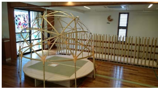
アプローチ竹柱材取付